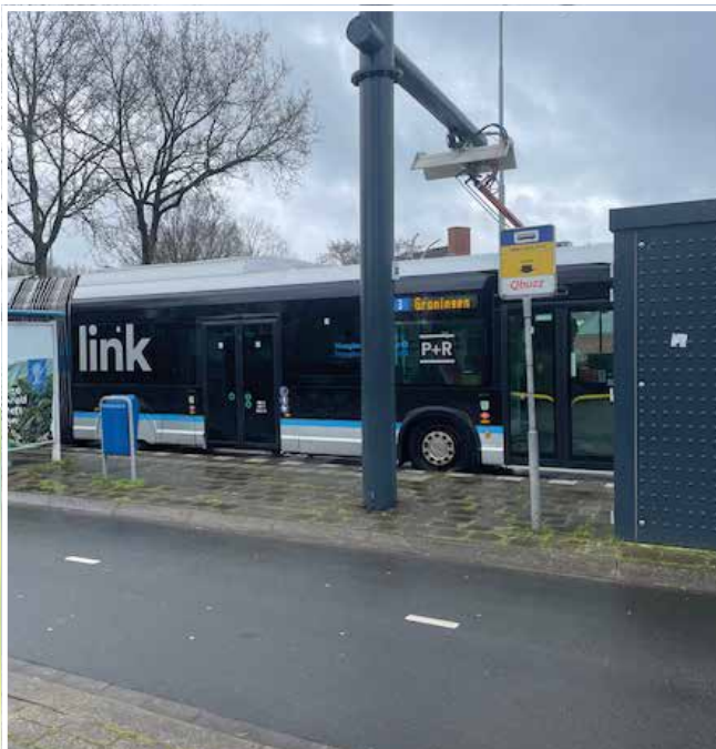
Bushalte De Linde Tolbert.

Het ‘Tolberter Tochtje’ is een voorbeeld van een mooie wandeling door enkele verschillende natuurgebieden en woonwijken van Tolbert. Het IVN heeft een plan voor een natuurroute in en om Tolbert. Daar zou een koppeling kunnen plaatsvinden met het ‘Tolberter Tochtje’. Meer