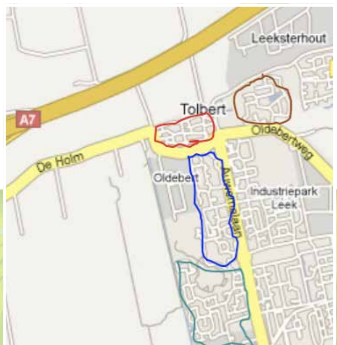
De verschillende huidige (2023) woonwijken van Tolbert: De Linde, Centrum, Sintmaheerd Noord en Zuid.

Vooralsnog lijkt, volgens informatie van Quadraten, dit niet op problemen te stuiten omdat er voldoende capaciteit aanwezig is bij de huidige basisscholen in de directe omgeving. Wel is het zo dat er zich meer en meer leerlingen uit de wijk Oostindie zich inschrijven op de basisschool De Regenboog. Het probleem is niet de capaciteit van de scholen maar het tekort aan vakbekwaam personeel. Dat is echter een landelijk probleem.