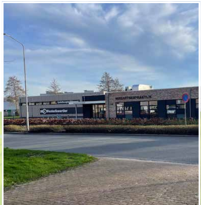
Gezondheidscentrum Oldebertweg Tolbert.

De oversteek Leuringslaan - Oldebertweg wordt als zeer gevaarlijk en onoverzichtelijk ervaren o.a. door de aanwezigheid van bosjes en de haakse bochten in het fietspad ter plaatse.